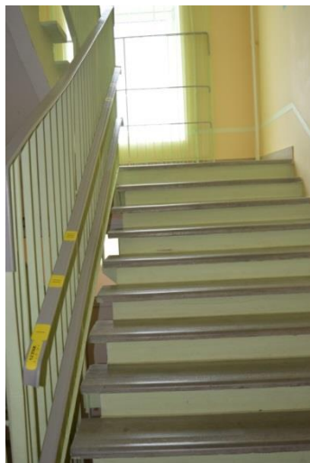
Фото №9 Лестница внутри здания