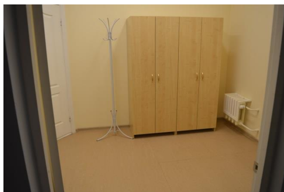
Фото № 16 Бытовая комната (гардеробная)