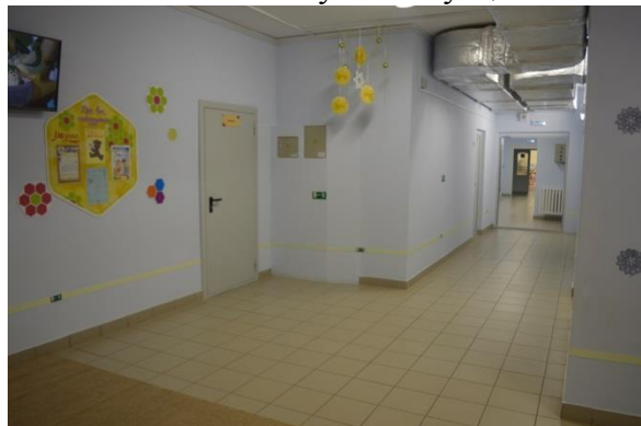
Фото №14 Пути эвакуации