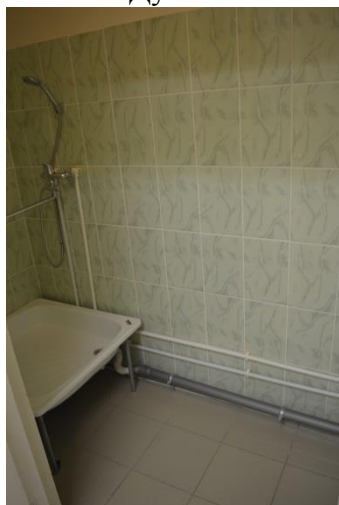
Фото №15 Душевая комната