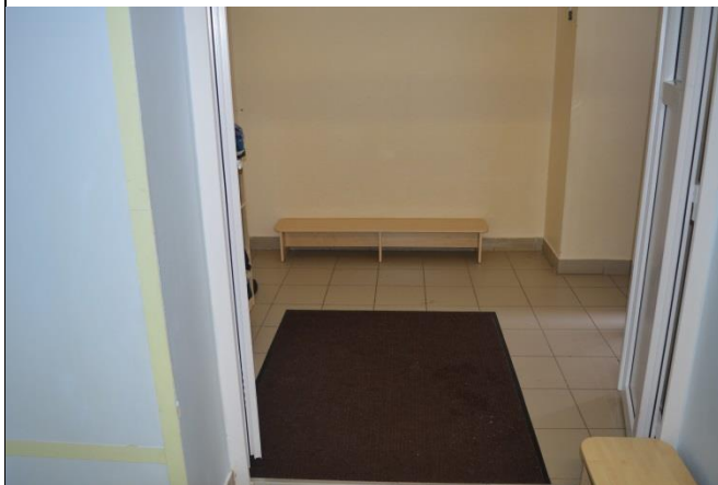
Фото №7 Тамбур