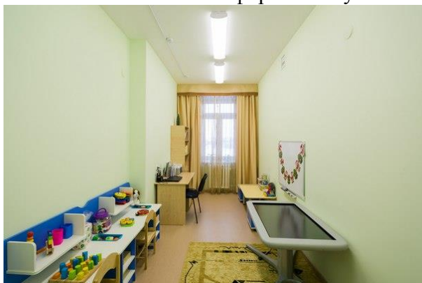
Фото №11 Кабинетная форма обслуживания