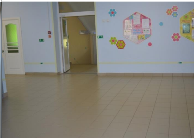
Фото №8 Коридор (вестибюль)