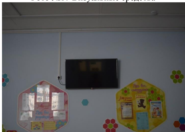
Фото №17 Визуальные средства