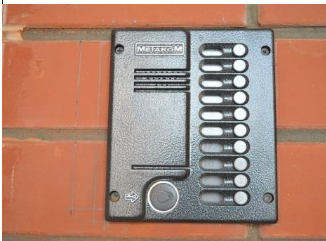
Фото №19 Акустические средства